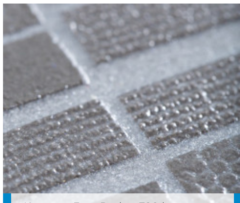
Kerapoxy Easy Design 700 in combinatie met Mapecolor Metallic Shining